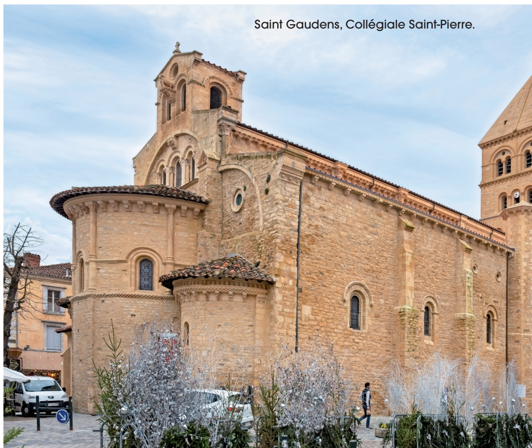
Saint Gaudens, Collégiale Saint-Pierre.