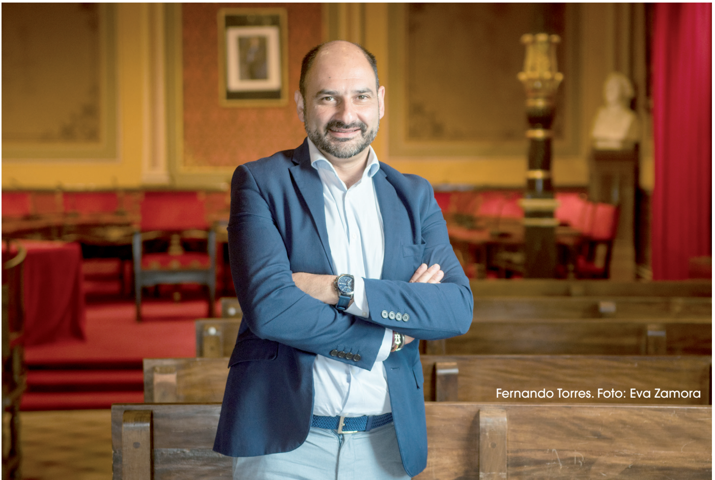
Fernando Torres.

ría tener cerca de los suyos, (colegios, universidad, hospital, ocio, cultura....). Una ciudad eminentemente turística e histórica que le dan una seña de identidad que marca, sin lugar a dudas, el carácter emprendedor y hospitalario de sus gentes y que se demuestra constantemente en la multitud de eventos y congresos que se celebran durante el año.