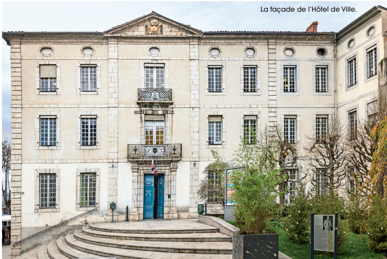
La façade de l'Hôtel de Ville.